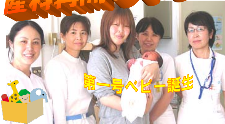
第一号ベビー誕生