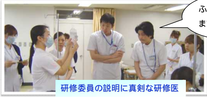
研修委員の説明に真剣な研修医