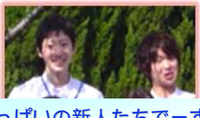
元気いっぱいの新人たちです